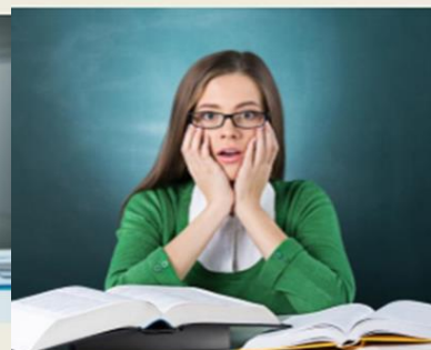
Ученик - ученик