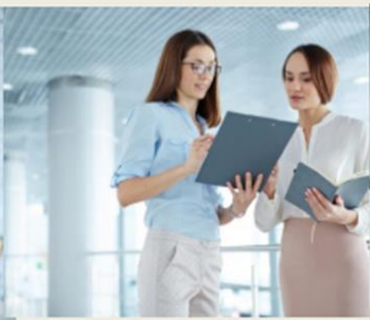
Работодатель – ученик