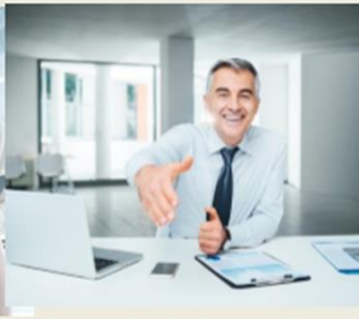
Работодатель – студент