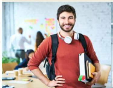
Студент – ученик