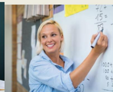
Учитель – учитель