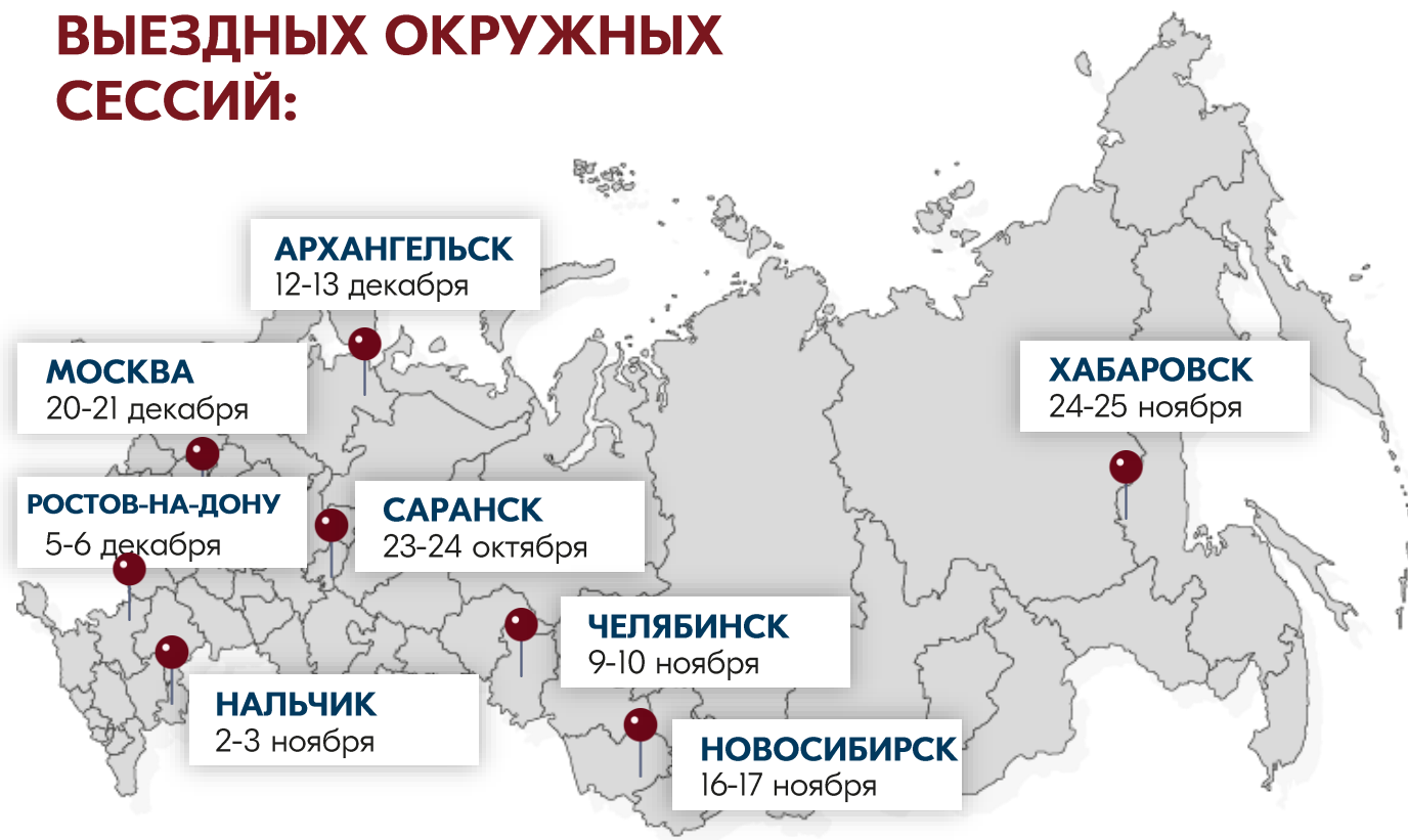
ГРАФИК ПРОВЕДЕНИЯ ВЫЕЗДНЫХ ОКРУЖНЫХ СЕССИЙ:

группа ВК «Сообщество наставников», информационные площадки партнеров